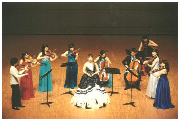
芸 18 アザレア音楽祭 2019