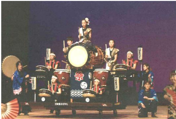
芸 38 打吹童子ばやし第 28 期演奏会