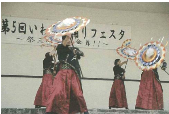
芸 57 第 5 回いわみ傘踊りフェスタ