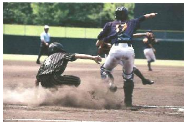
ス 7 大山エリア国際少年野球大会