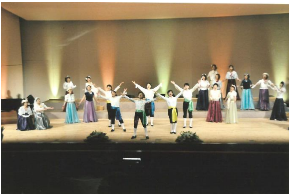
芸 8 第 17 回こーらす朝の会ファミリーコンサート