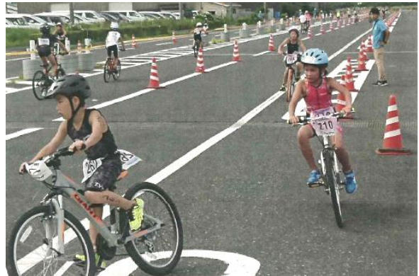
ス 14 第 9 回岩美キッズトライアスロン全国大会