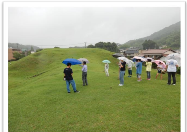
出雲国風土記フィールドワーク