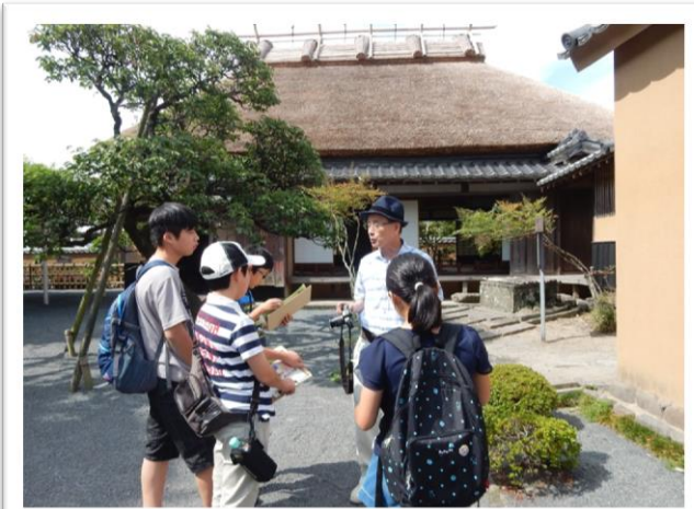
宿泊研修・福沢諭吉旧居見学