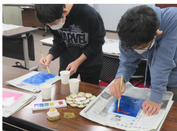
書道(刻字を楽しもう)