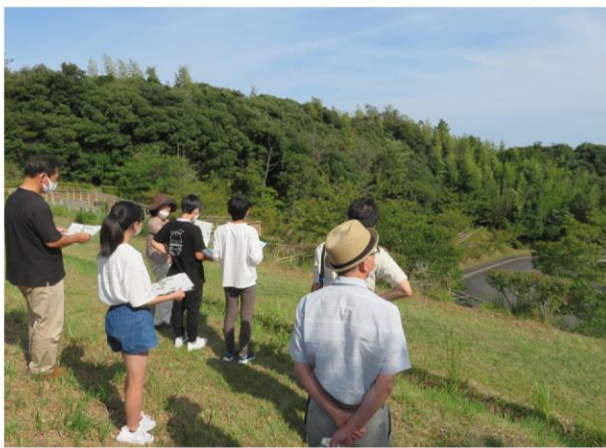
出雲国風土記フィールドワーク