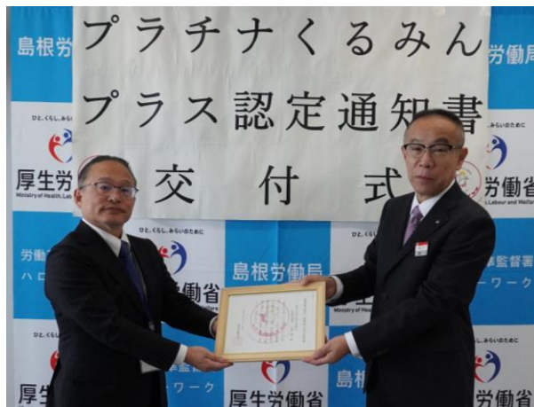
11/12に開催された認定通知書交付式の様子