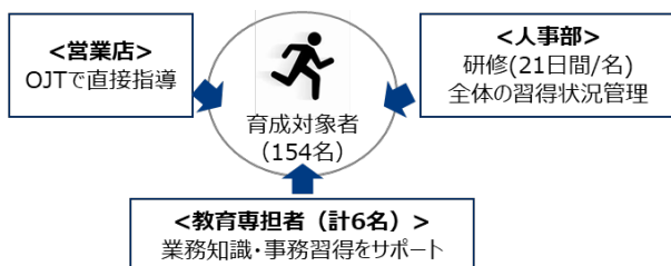
図23 リスクリング施策の全体像

※リスクリング投資額…2021年度：335百万円、2022年度：332百万円 (リスクリング期間中の教育専担者、育成担当者の人件費合計)