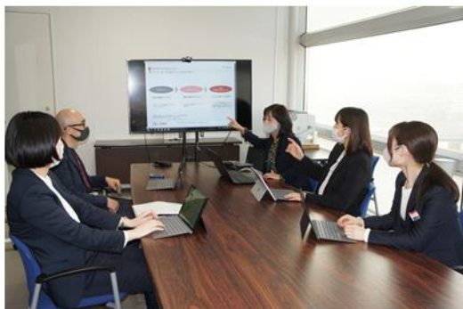
(デジタル専門人材が社内で議論する様子)

(※) …2022 年 1 月に開催した当行主催の中小企業の DX に関する講演会にご参加いただいたお客様を対象に、“DX の取り組み状況” や “IT 担当者の状況” 等についてアンケートを実施しました。その結果、DX に関心をお持ちのお客様は多いものの、専門人材の不在、何から手をつけたらよいかわからない等の理由で DX に向けて着手できていない状況が見えてまいりました。