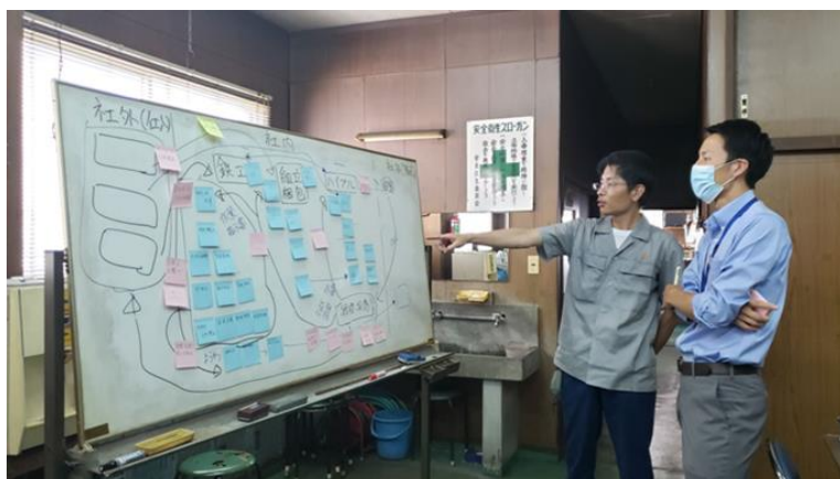
ワークショップでの業務内容確認の様子（行員右側）