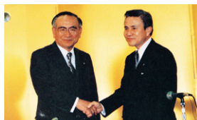
1990年11月、ふそう銀行と合併 覚書締結