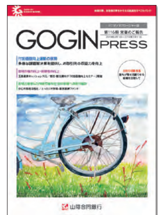
ミニディスクロージャー誌