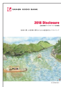
ディスクロージャー誌