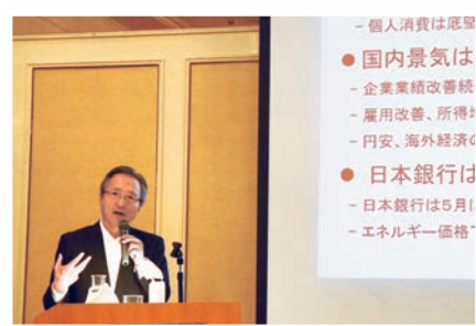
会社説明会の様子