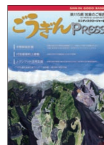
ミニディスクロージャー誌