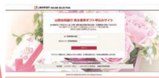
株主優待専用Webサイトの画面イメージ

2018年度からは、ギフトカタログの進呈に代わり、「株主優待専用Webサイト」からの商品選択・お申込みが可能となるよう、株主優待制度をリニューアルいたしました。