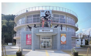
複数のメーカーの作品が一カ所で鑑賞できる全国的にも珍しい施設