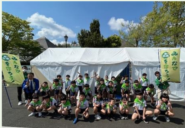
松江市立宍道小学校4年生の皆さん